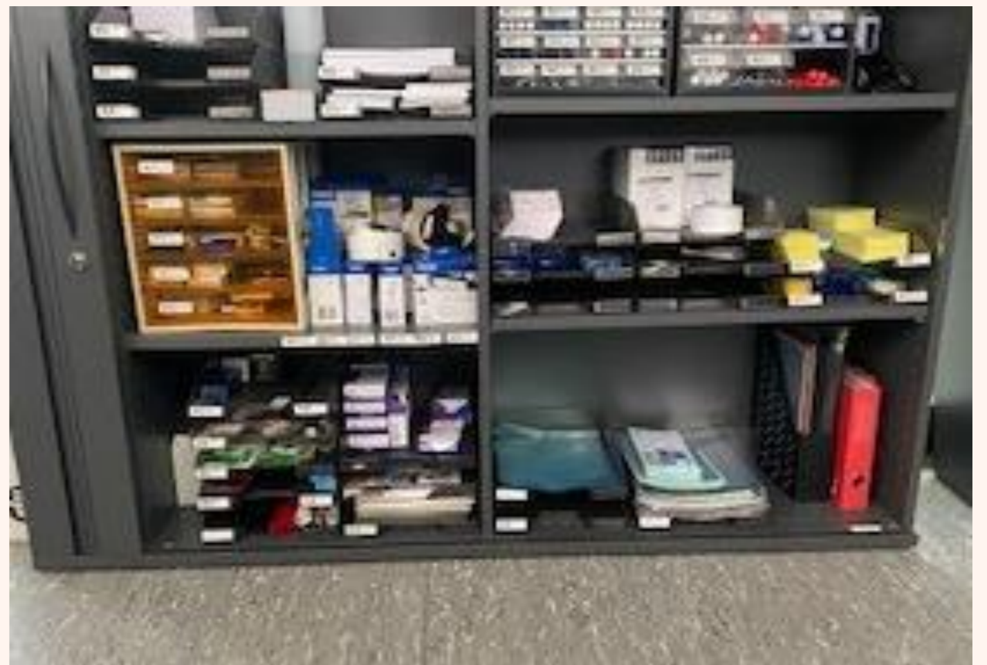
Abb 2: Sideboard wie es jetzt aussieht