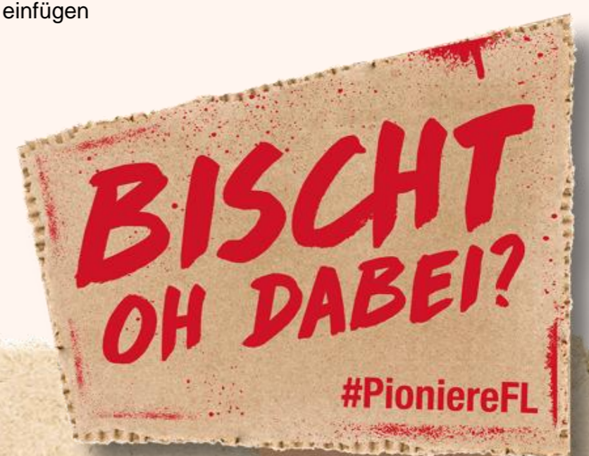
Abb 2: hier Beschreibung einfügen