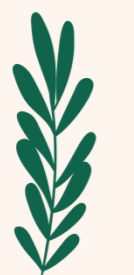
Abb 1: hier Beschreibung einfügen