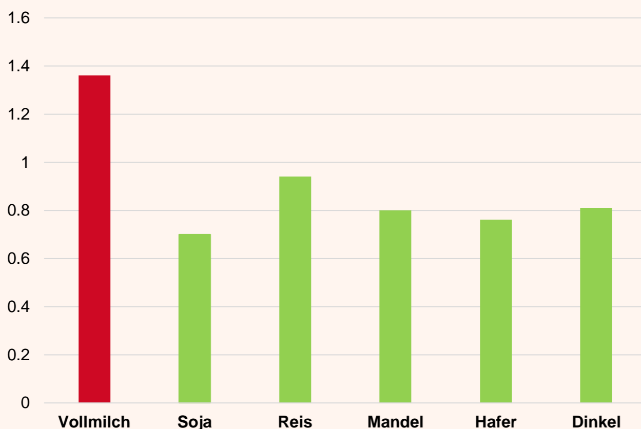
Abbildung 1: kg CO 2 -Ausstoss pro Liter Getränk

Die vegane Milch hat einen viel niedrigeren CO 2 -Ausstoss als die normale Milch, welches man auch deutlich in der untenstehenden Grafik sieht.