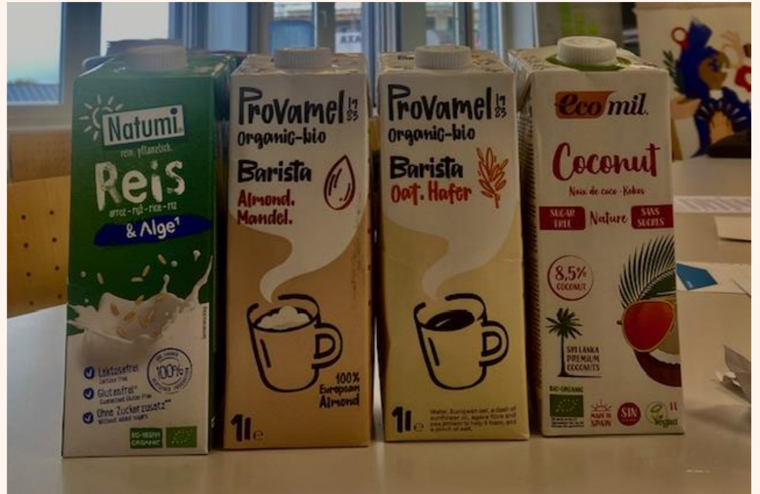
Abbildung 2: unsere Alternativen zur Kuhmilch