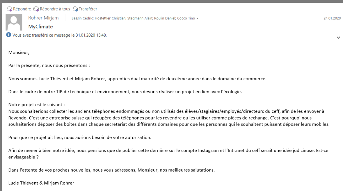
Figure 2 Courriel envoyé au Directeur général avec les Directeurs des différents domaines en copie