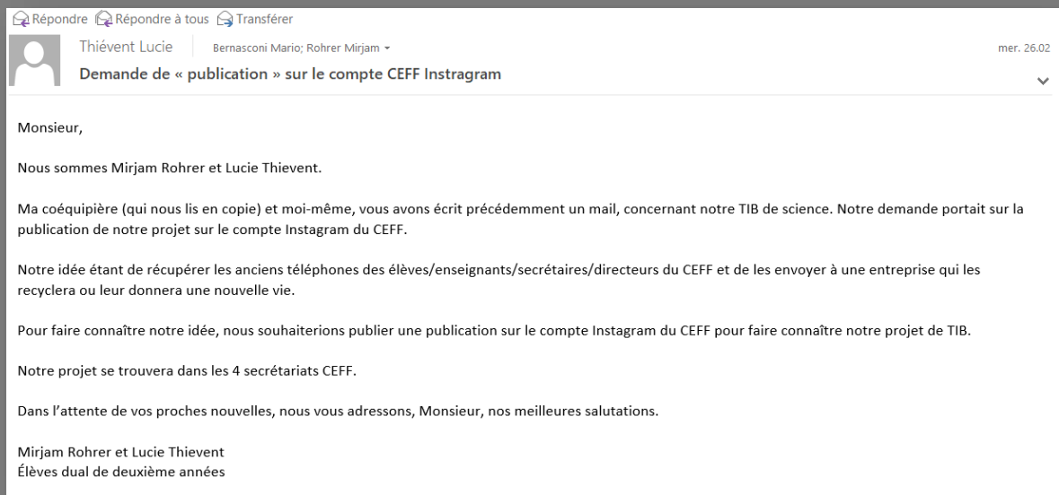
Figure 1 Courriel envoyé au responsable des réseaux sociaux