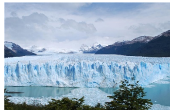
Abb. 1: Unsere Reisen ( http://www.pitohui.net/reisen/los_glaciares.html , Datum des Zugriffs)

Durch den CO 2 Ausstoss wurde bereits das Klima verändert. Es gab eine globale Luft- und Meerestemperaturen Anstieg. Daher das die Temperatur global angestiegen ist, gibt es einen Rückgang von Schnee- und Eisvorkommen, siehe im Bild, Abb.1. Ausserdem schmelzen die Gletscher täglich durchschnittlich 7m. Das ist der Grund, weshalb der Meeresspiegel in den letzten Jahren angestiegen ist.