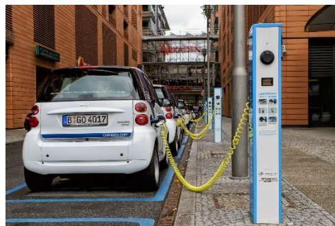
Abb. 2: Elektromobilität-Wikipedia( https://upload.wikimedia.org/wikipedia/ , Dazum Zugriff)

Ein Elektroauto ist für die Stadt geeignet oder für Firmen, welche kurze Strecken fahren müssen. Ausserdem ist es umweltbewusster und es hat in der Schweiz niedrige Strompreise. Bei einem Neukauf eines Elektroautos spart man bei der Steuerlast & Versicherungsbeiträge. Ein Vorteil kann ebenfalls, das geräuschlose Fahren sein, wobei es auch einen Nachteil bilden kann, weil die Mitmenschen das Auto nicht kommen hören. Ebenfalls ein Nachteil ist, dass das Elektroauto nur für kurze Strecken geeignet ist und es eine gewisse Einschränkung wegen des Aufladens der Batterien vorweist. Der Unterhalt ist ebenfalls eher teuer und die Monatsmiete der Batterien ergeben auch einen gewaltigen Beitrag. Hier kommt es also auf den Zweck des Autos drauf an, z.B. für Firmen, in der Stadt usw. aber weniger geeignet ist es fürs Land, und längere (+2 Stunden) Strecken.