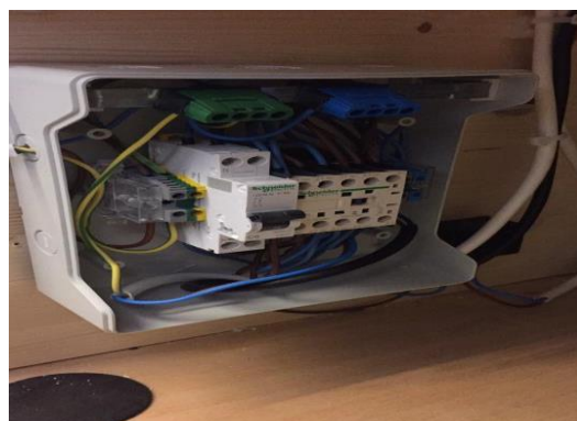
Figura 4: il quadro elettrico

Nell'attesa che arrivavano i pezzi, ho costruito un mobile per poterci mettere tutti gli apparecchi e per appoggiarci il frigorifero sopra.