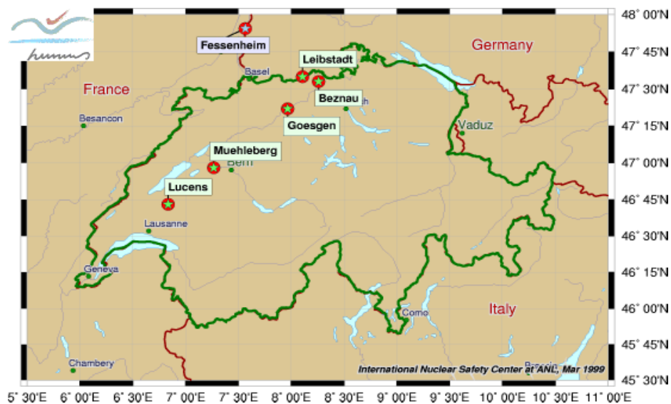
Figura 1: La dislocazione delle cinque centrali nucleari in Svizzera

In questo grafico, si possono notare le partizioni di produzioni di corrente in Svizzera.