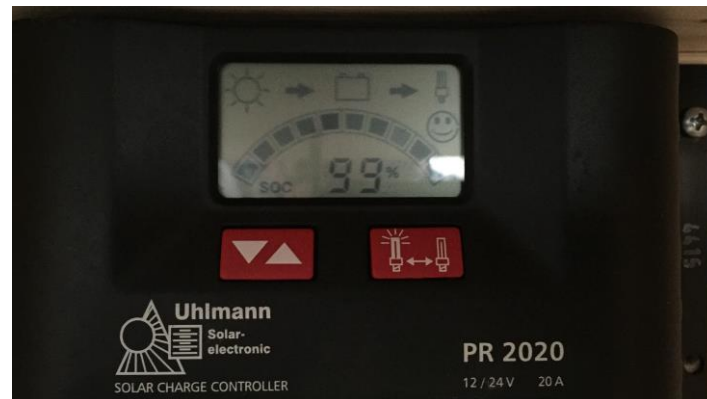
Figura 11: il regolatore di carica

Nel regolatore di carica si collegano i due cavi del pannello fotovoltaico, due cavi della batteria e due cavi dell'inverter. Esso mostra anche se ci dovessero essere degli errori di cablaggio.