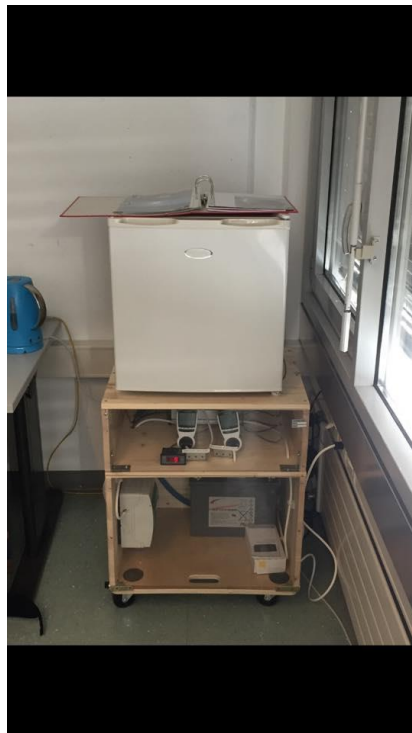
Figura 6: progetto concluso

In quest'ultima foto si può notare il frigorifero che funziona tramite l'energia prodotta con il sole.