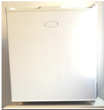
Figura 7: il frigo

Conoscendo il consumo di 420Wh/giorno, posso eseguire il calcolo del pannello fotovoltaico.