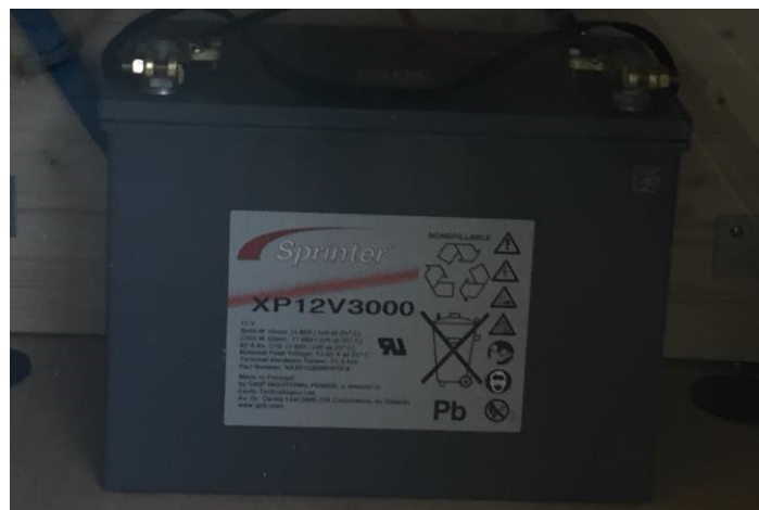
Figura 10: la batteria

Il calcolo è il seguente: (420 \text{ Wh} \times 2:12): (0,7 \times 1,1) = 90 \text{ Ah}