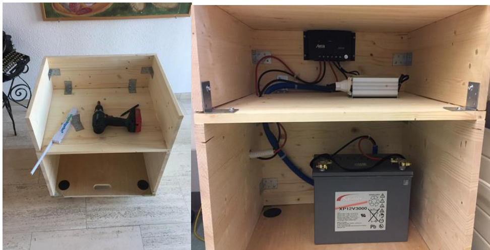
Figura 3: costruzione del mobile

Nell'attesa che arrivavano i pezzi, ho costruito un mobile per poterci mettere tutti gli apparecchi e per appoggiarci il frigorifero sopra.