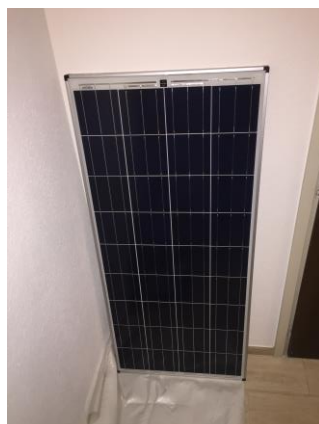
Figura 8: il pannello fotovoltaico

Nel mio caso ho dovuto scegliere un pannello da 150 Watt.