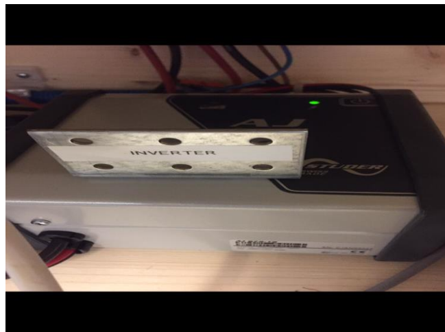
Figura 9: l'inverter

Se l'inverter è male dimensionato, si brucerà. Per questo motivo va scelto un inverter di minimo 285 W.