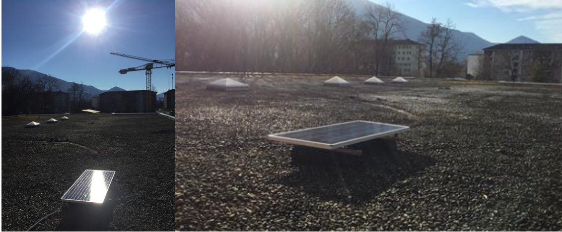
Figura 5: il pannello fotovoltaico

Una volta arrivato il pannello e il resto del materiale, l'ho posizionato sul tetto della Scuola Artigianale di Locarno. Dal pannello partono due cavi che gli ho collegati al regolatore di carica.