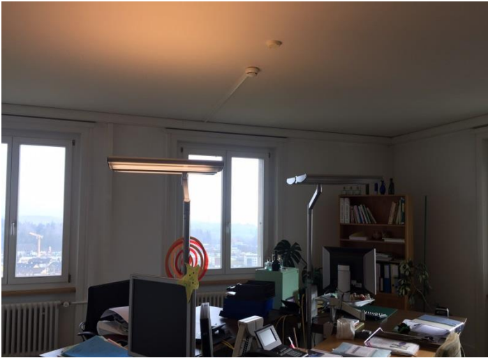
Stehlampe in einem genutzten Büro

Durch Befragungen der Büromitarbeiter des Wallierhof, sind wir zu folgendem Ergebnis gekommen.