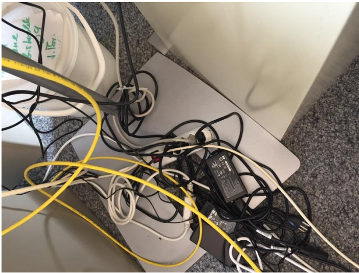
Steckliste im Einsatz

Wie man auf dem folgenden Bild sieht, sind nebst der Lampe noch viele andere Geräte in der Steckliste eingesteckt. Da zum Beispiel das Telefon Alarm geben würde, wenn man es ausschaltet, kann man die Steckliste nicht ausschalten. Darum ist die Lampe dann immer auf Standby und braucht trotzdem noch Strom.