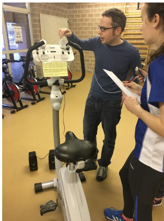
Abbildung 1, Ergovelo

Freundlicherweise hat der Elektriker uns dieses Velo zum Ausprobieren angeboten. Wir haben mit ihm einen Termin vereinbart, der am 19.12.16 stattfand.