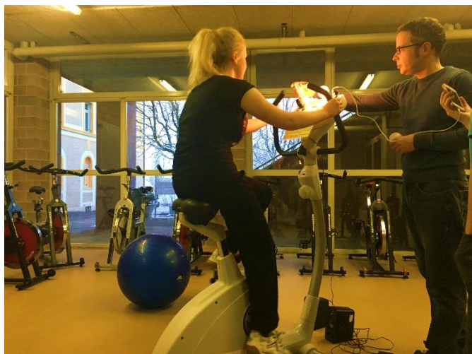
Abbildung 2. Ergo-velo ausprobieren