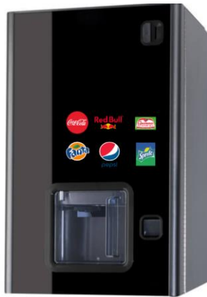
Abb. 1: Konzept unserer Getränkemaschine Quelle: Selbstentwurf [Zugriff: 23.12.2016]

Leider ist es nicht so umsetzbar wie wir dies geplant haben, jedoch konzentrierten wir uns ab diesem Zeitpunkt auf die Dokumentation und haben dennoch einen Prototyp der Getränkemaschine entworfen.