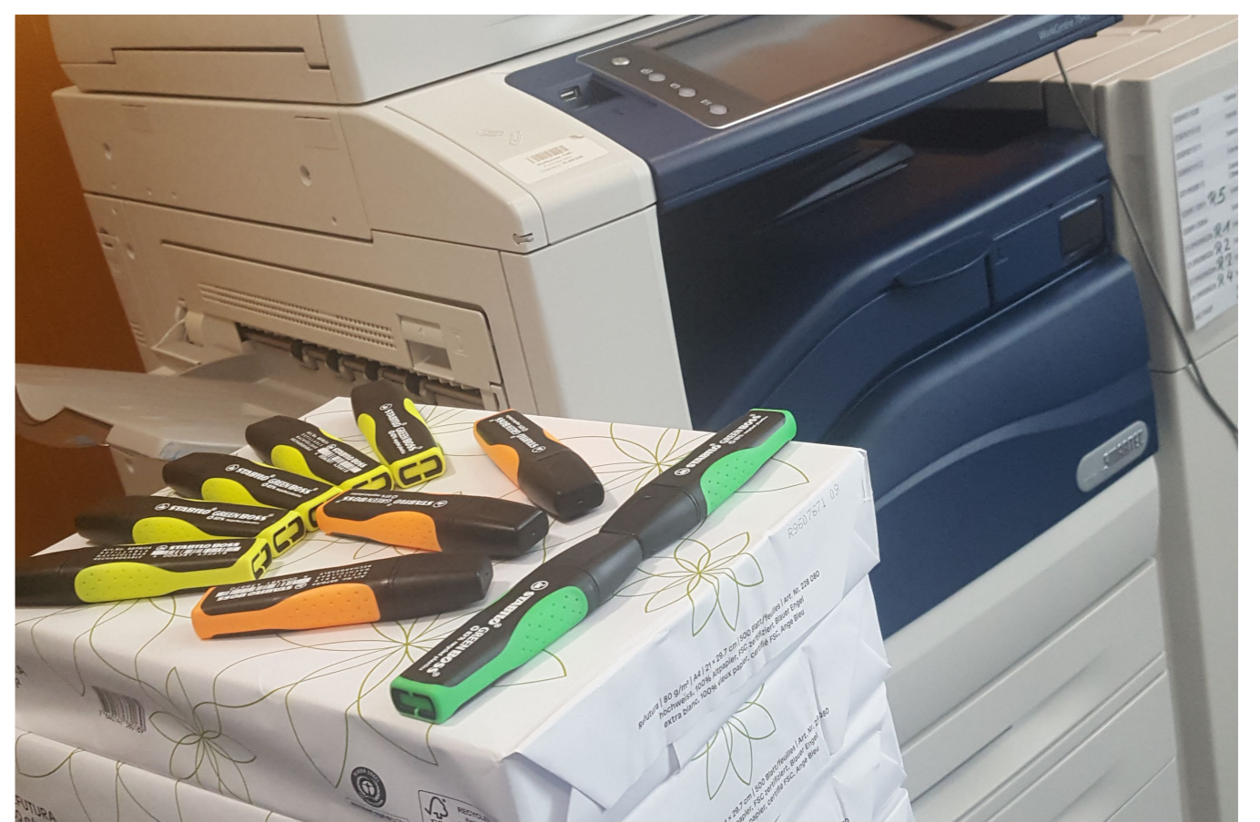
Stabilos und der Papierverbrauch mal anders...