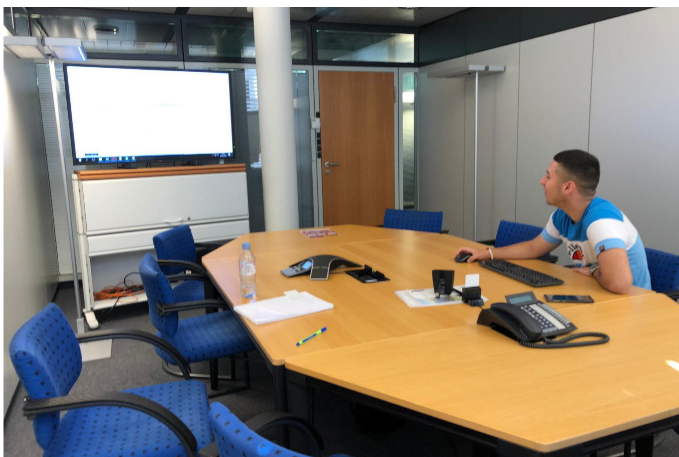
Abb. 1: Ecosia Einführung mit Besprechung weiterer Schritte

14'400 Bäume werden jährlich finanziert -> Jährlich 144'000kg CO 2 durch Bäume gebunden